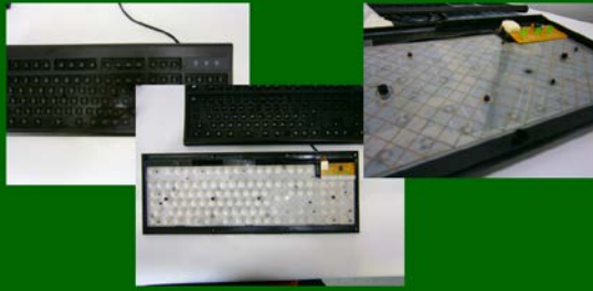
カスタマイズドキーボード